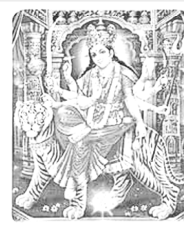
คลิกเพื่อชมภาพบูชาสวยงาม