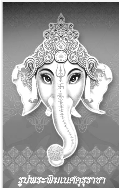
รูปพระพิฆเนศสุริยราช ออกแบบโดย siamganesh.com

"สยามคณาศ" เว็บไซต์ให้ข้อมูล ความรู้ ตาตา รูปภาพ และงานศิลปะ ของพระพิฆเนศและองค์เทพฮินดูมากที่สุด