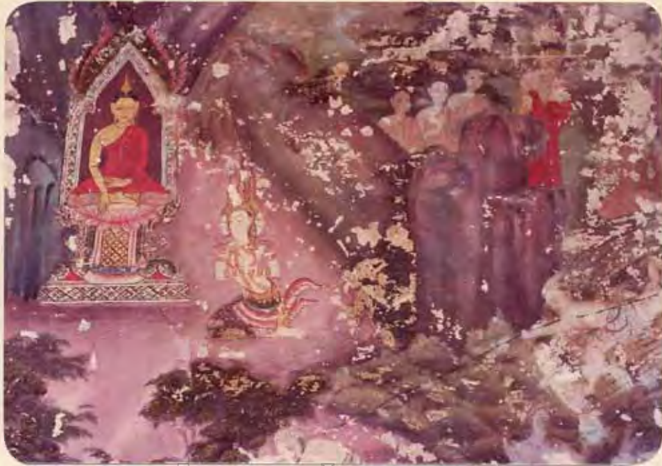
มหาวิททยาลัยศิลป์นคร สงวนลิขสิทธิ์