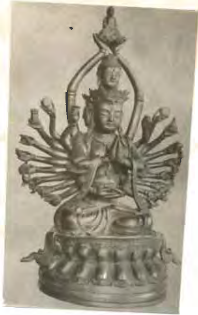
รูปที่ 103