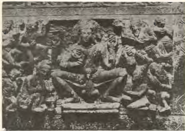
พระพุทธรูปปางวิปัสสนา รูปที่ 13