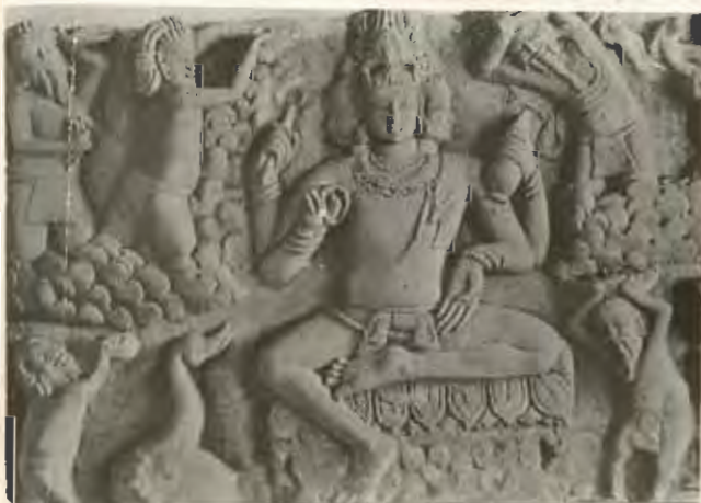
พระพุทธรูปปางวิปัสสนา รูปที่ 15