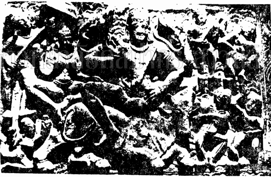
45. The Hoceppayyatha temple, Siva.

ภาพที่ 32 ภาพสลักนูนนํ้าพระอุมาบนเพดานถ้ำวัดราชมงคลจากยุคศิลปะ หุรณโกลน (พุทธศตวรรษที่ 11-17) (Early Chāluya Art at Aihole)