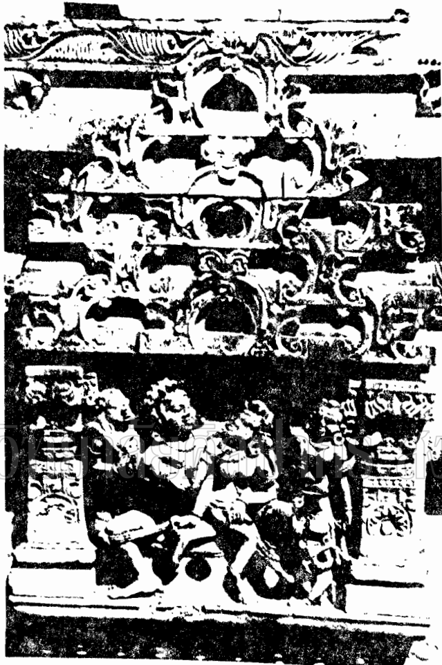
ภาพที่ ๕ ภาพสลักปูนปั้นที่วัดสุทัศนเทพวรารามราชวรมหาวิหาร กรุงเทพมหานคร