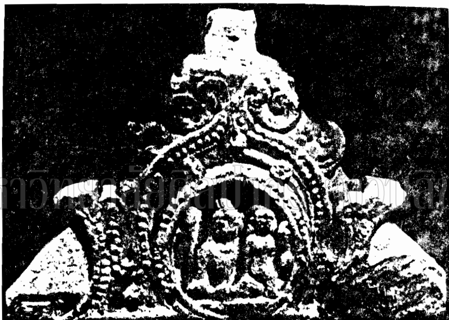
ภาพที่ 1 ภาพสลักปูนปั้นพระอุมาเทศวรมัยคูปาละ (พุทธศตวรรษที่ 9-11) ปัจจุบันเก็บรักษาที่พิพิธภัณฑสถานมณฑล (Gupta Sculpture P.72 )