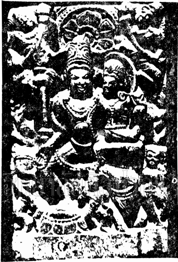
ภาพที่ ๖ ภาพสลักหินของพระอุมาและพระศิวะจากถ้ำคัทโธล (พ.ศ. ๒๒๖๕ (๑๑-๑๒))

(Brahmanical Icons in Northern India F.18)