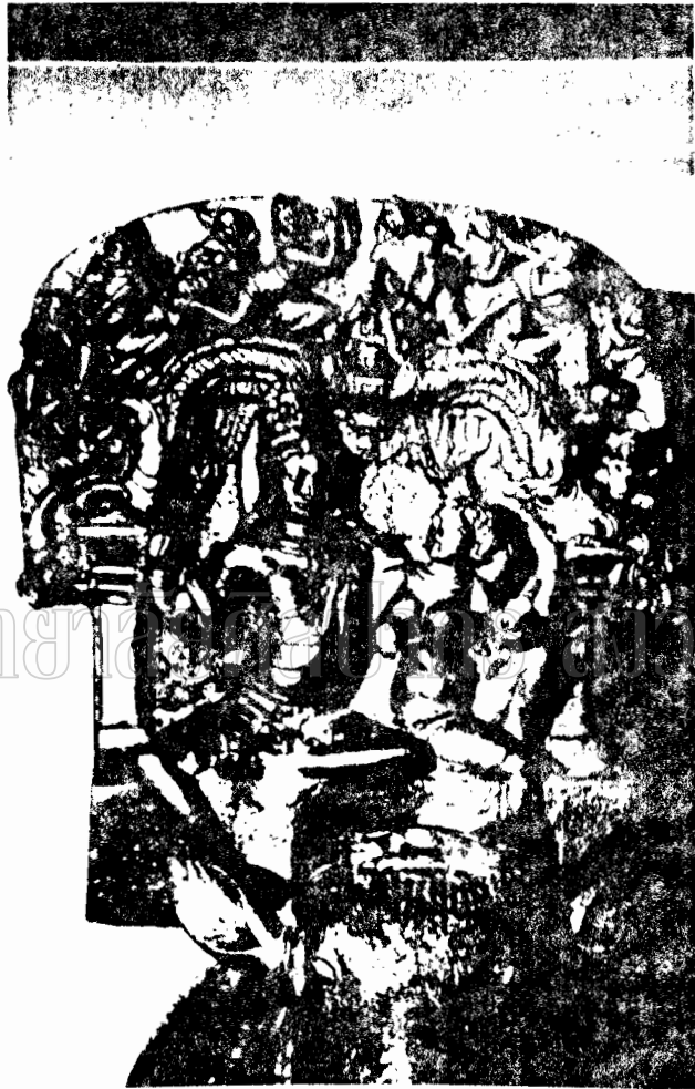
ภาพที่ ๖๖. ภาพสลักหินที่พระอุษามหาเจดีย์ วัดมหาธาตุยุวราชรังสฤษฎิ์ กรุงเทพมหานคร (Art Asiatique Tome XXVIII)