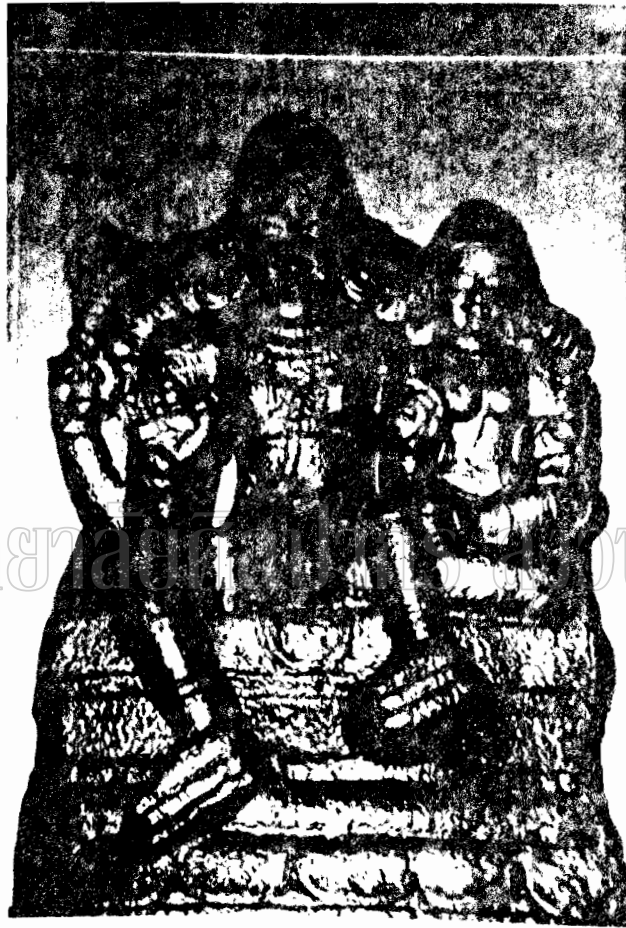
ภาพที่ 37 ภาพสลักหินเพนียดถึงพระอุมาและพระนารายณ์จากวัดสุทัศนเทพวราราม (รูปสลักสมัย 11-14)