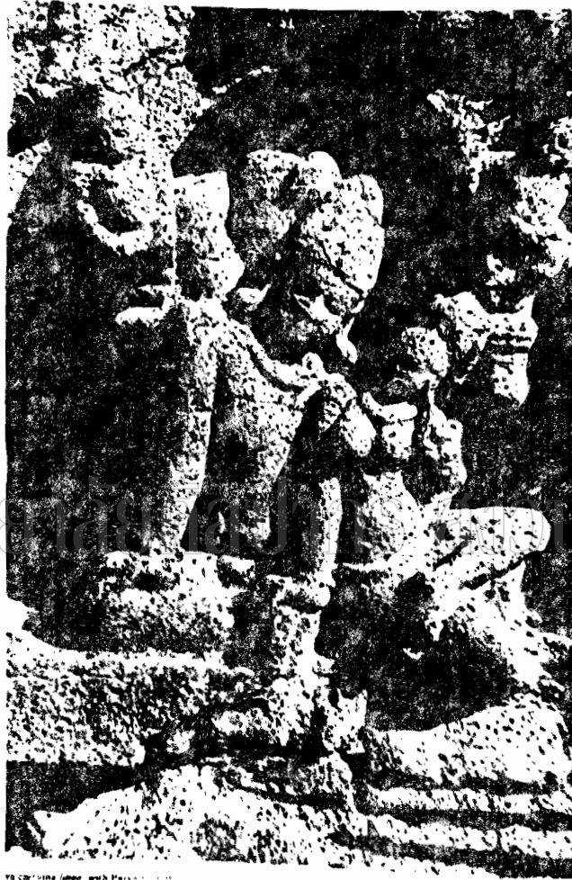
YB 001518 (Image with Permission)

ภาพที่ 35 ภาพสลักหินที่วัดพุทธบาทสระบุรี (วัดพระพุทธบาทสระบุรี) จังหวัดสระบุรี (พระบาทสมเด็จพระพุทธยอดฟ้าจุฬาโลกมหาราช)