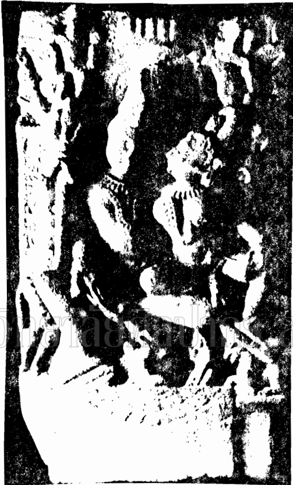
ภาพที่ ๑๑ ภาพลัทธิพราหมณ์ที่วัดพระรามเก้า วัดศรี วัดที่เมืองลพบุรี (ภาพที่ ๑๐)