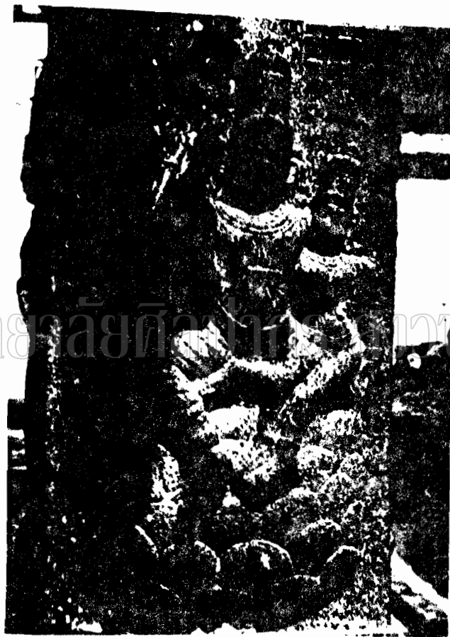
ภาพที่ ๖๑ ภาพสลักปูนล่ำพระอุมาเนศวรบนเสาศาถิม ที่วัดสุพรรณมณี เมืองทริปุราปุรี จิลาประเมียบโกลวะ (พุทธศตวรรษที่ ๑๑-๑๔)