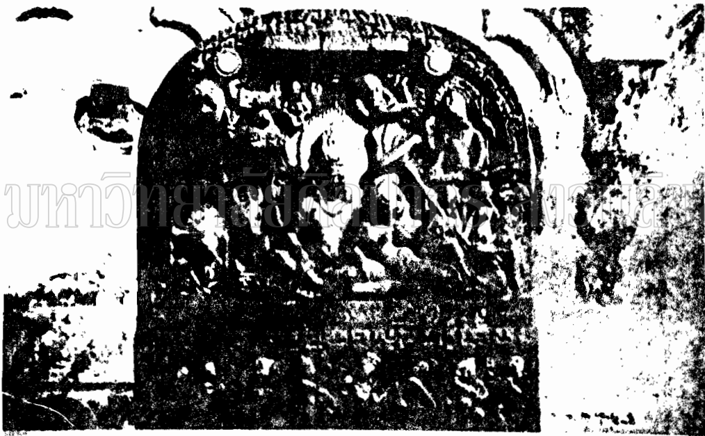
ภาพที่ 30 ภาพสลักหินแกะสลักพระพุทธรูปและพระสาวกในโพธิ์ สมัยทวารวดี (พบที่วัดพระปฐมเจดีย์) (ON Karttikey P.22)