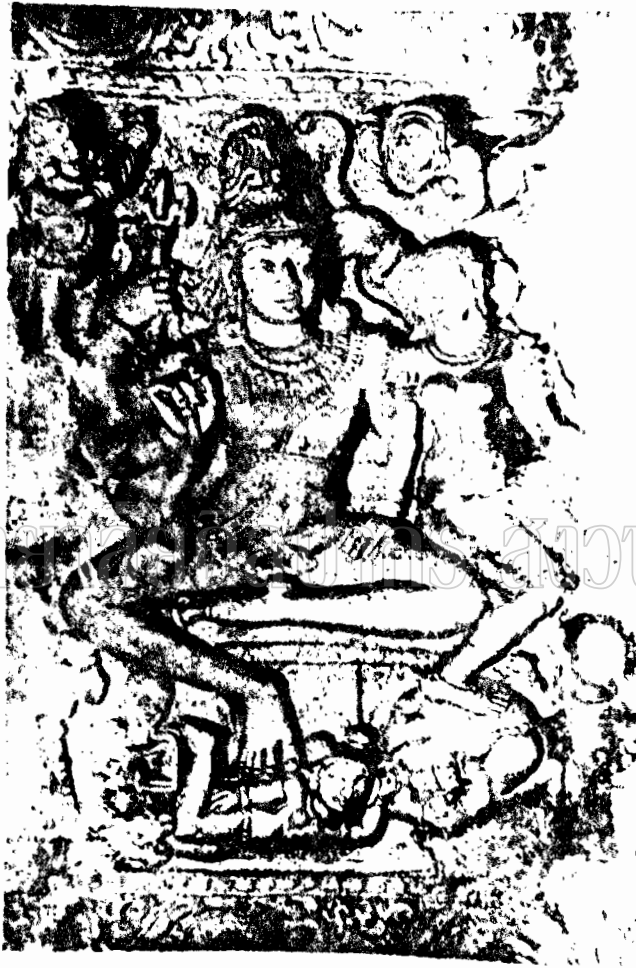
ภาพที่ 34 ภาพสลักปูนปั้นพระสุกานเทศวร สลักที่วัดจากุสะ จังหวัดละแวก (พุทธศักราชที่ 11-17)