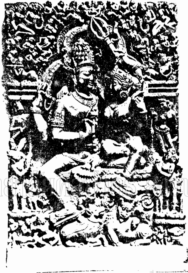
ภาพที่ 10 - พระวิष्ณู วิษณุพระกฤษณะ พระมหากษัตริย์-เทพเจ้า อารยวิภาร (รูปเคารพที่ 15-16) วิษณุเทพเจ้ากฤษณะ เจ้าโลก มีพระโอรสพระธิดามาก (Ex. of Indian Sculpture F.7)