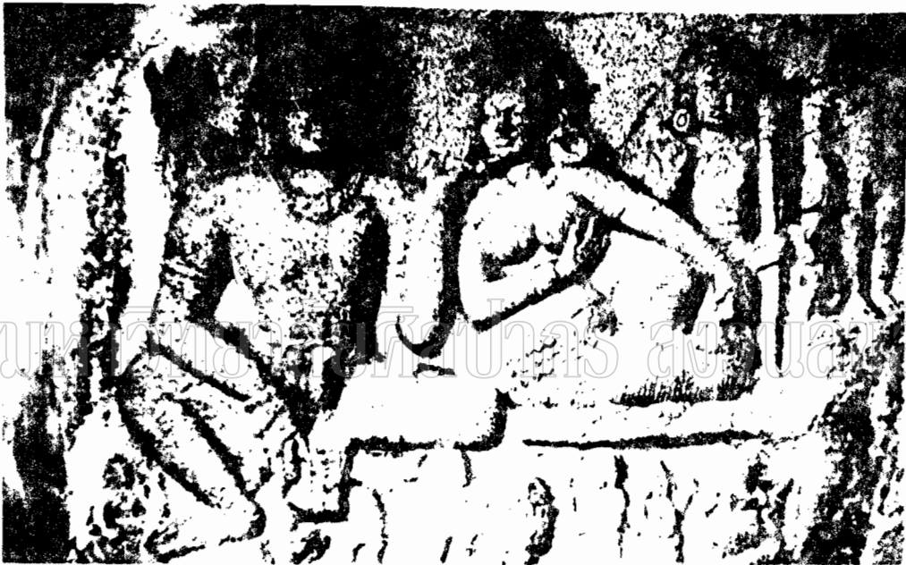
ภาพที่ 17 ภาพสลักปูนดำรูปพระอุมาและพระศิวะ ปางนาคะ บนแท่นหินทราย (พุทธ ศตวรรษที่ 13)

(The art of Eastern India 300-800 P.199)