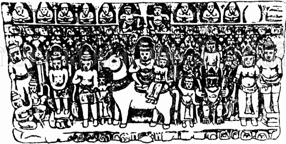
ภาพที่ 50 ภาพแกะสลักพระอุมาและพระนันทิ์ที่วัดพระแก้วในนครวัด พังงา คือ เป็นศิลปะของเขมรโบราณ (ราวพ.ศ. 1560-1600) (Asie du Sud-Est : le Cambodge P.287)