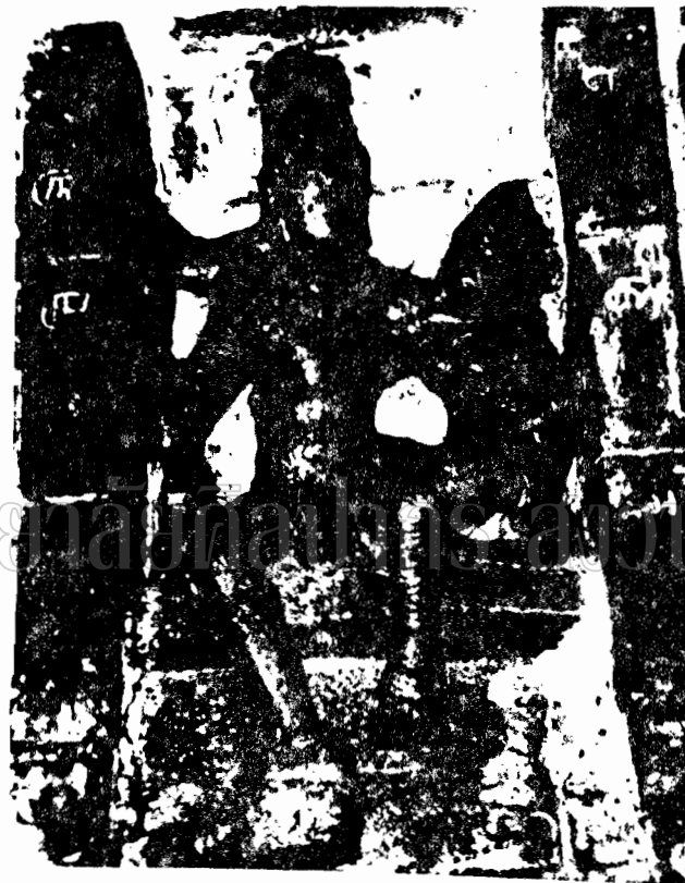
ภาพที่ 36 ภาพสลักบนถ้ำแห่งอูมาเรอเวอร์ประพันธ์ผู้ประพันธ์ที่เอโดะงวัก เมลักกูมบูร์ เป็นศิลปะสมัยก่อนประวัติศาสตร์ (พุทธศตวรรษที่ 11-14) (Art Asiatique Tome XX VIII)