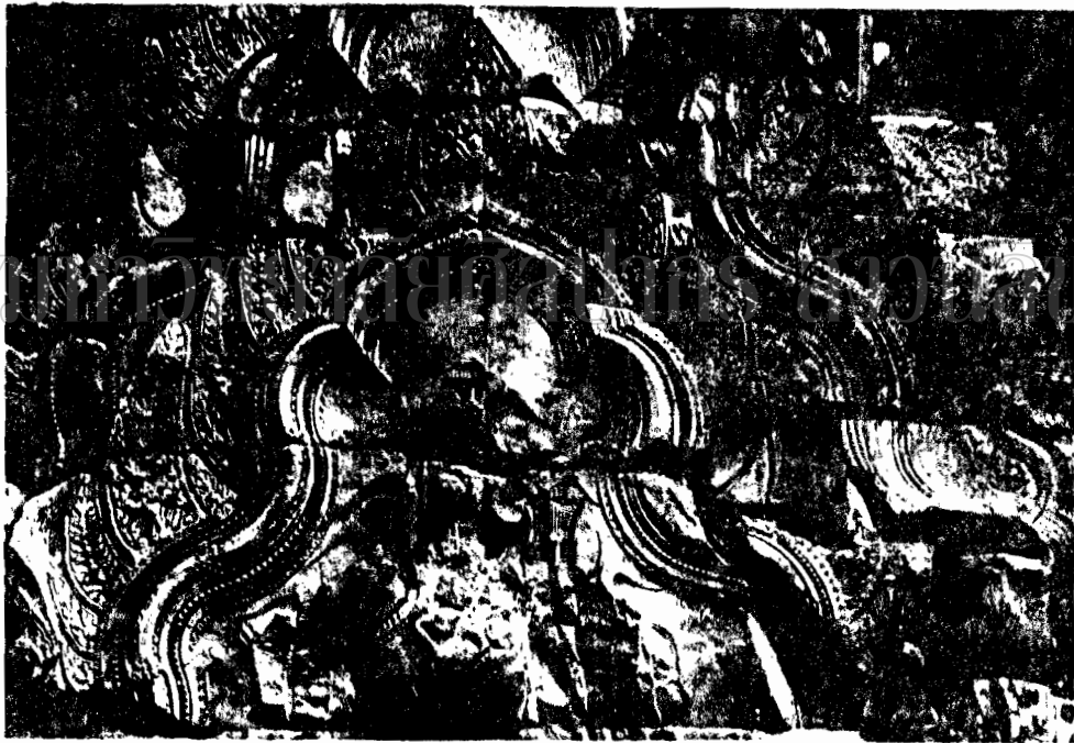
ภาพที่ 59 ภาพสลักปูนดำรูปพระพุทธรูปนาคปรก มีฐานชั้นหนึ่งฐานเล็ก โถง ของมณฑปปราสาทปรือราม ช่องปราสาทเขามะรุ้ง จ. บุรีรัมย์ (ราวพ.ศ. 1650-1720)