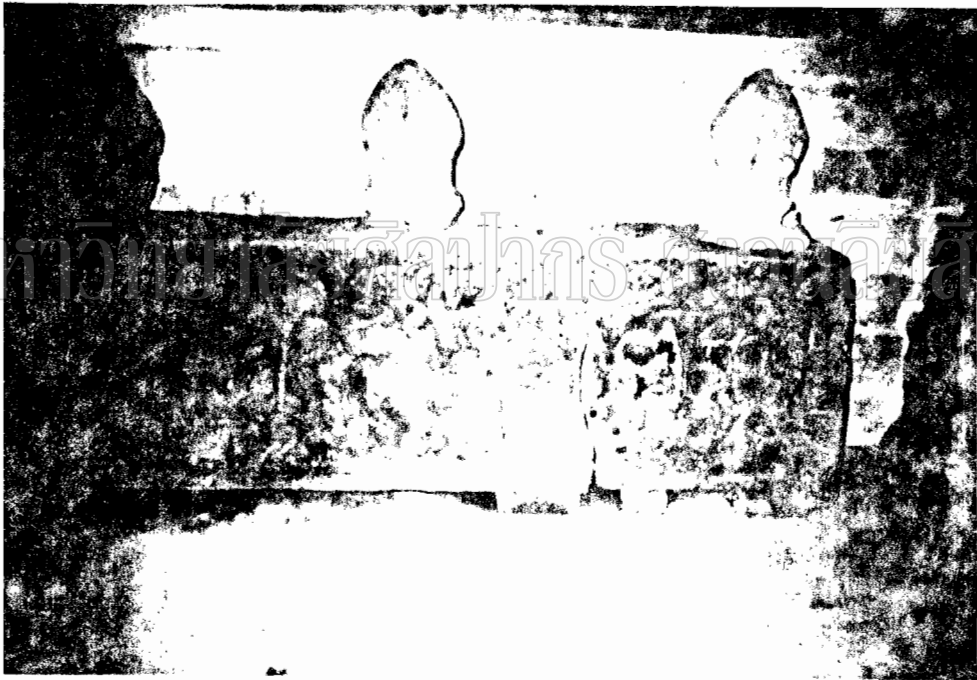
ภาพที่ 61 กับ ปางรูปพระอุมาและพระพิรุณปราสาณในวัดพระแก้ว เป็นจิตรกรรมแบบไทวน (อาจวาดก่อนพุทธศตวรรษที่ 16)