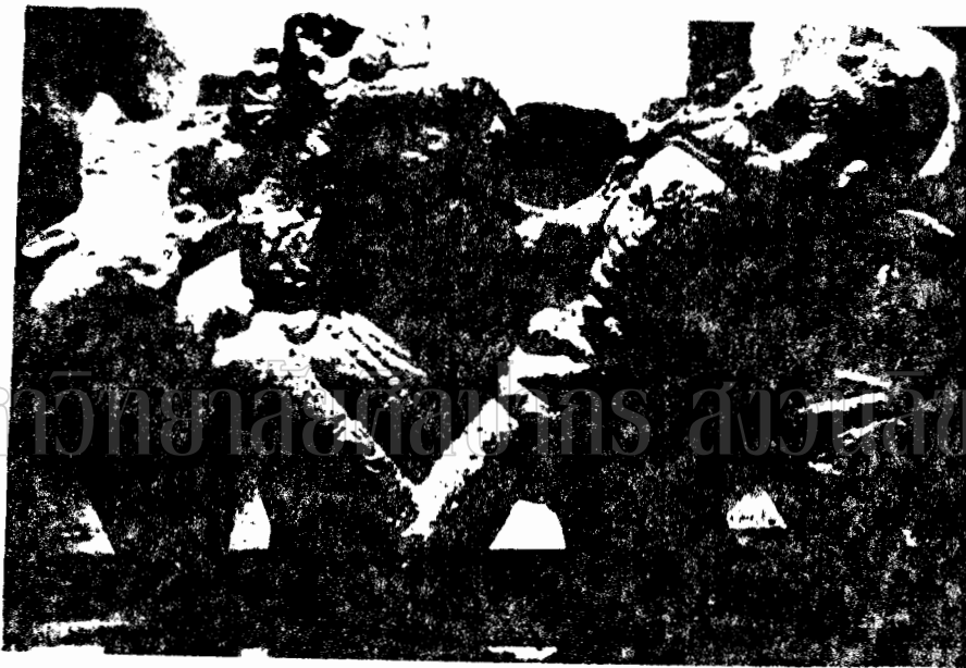
ภาพที่ ๔๑ ภาพสลักปูนปั้นรูปพระอุมาเทวี หรือ พระลักษมณ์ เป็นศิลปะสมัยกลาง (พุทธศตวรรษที่ ๑๕) ปัจจุบันเก็บรักษาไว้ที่พิพิธภัณฑ์รัฐอัสสัม (Icons and Sculpture of Early Medieval Assam F.44)