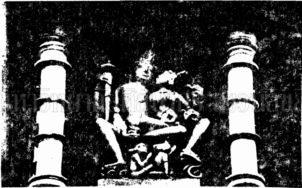
ภาพที่ 12 ภาพสลักปูนปั้นพระอุมมาและพระประสิทธิ์ที่ทางเข้าเขตลัทธิปุราโห (พุทธศตวรรษที่ 15-16)