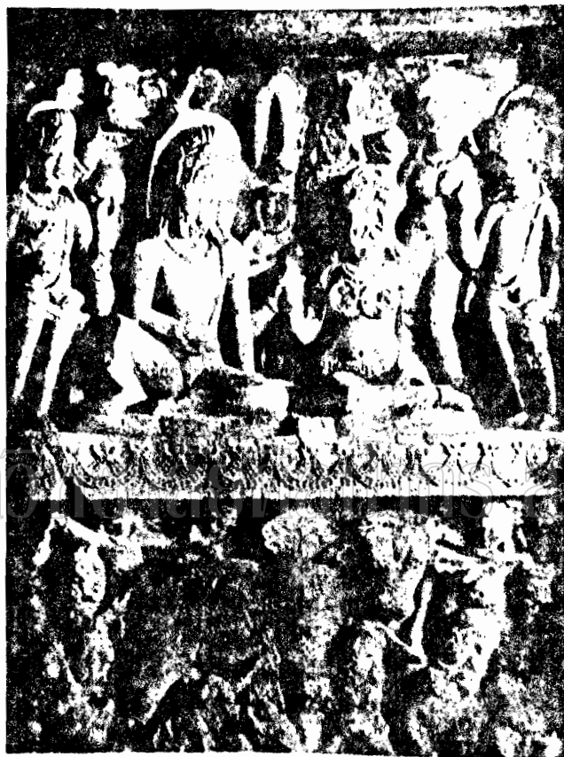
Umamahadevaramurti. Stone panel: Kitora.

ภาพที่ ๒๗ - องค์แม่ลักษมีและ องค์พระนารายณ์บนดอกบัว (ภาพประกอบที่ 11-14)