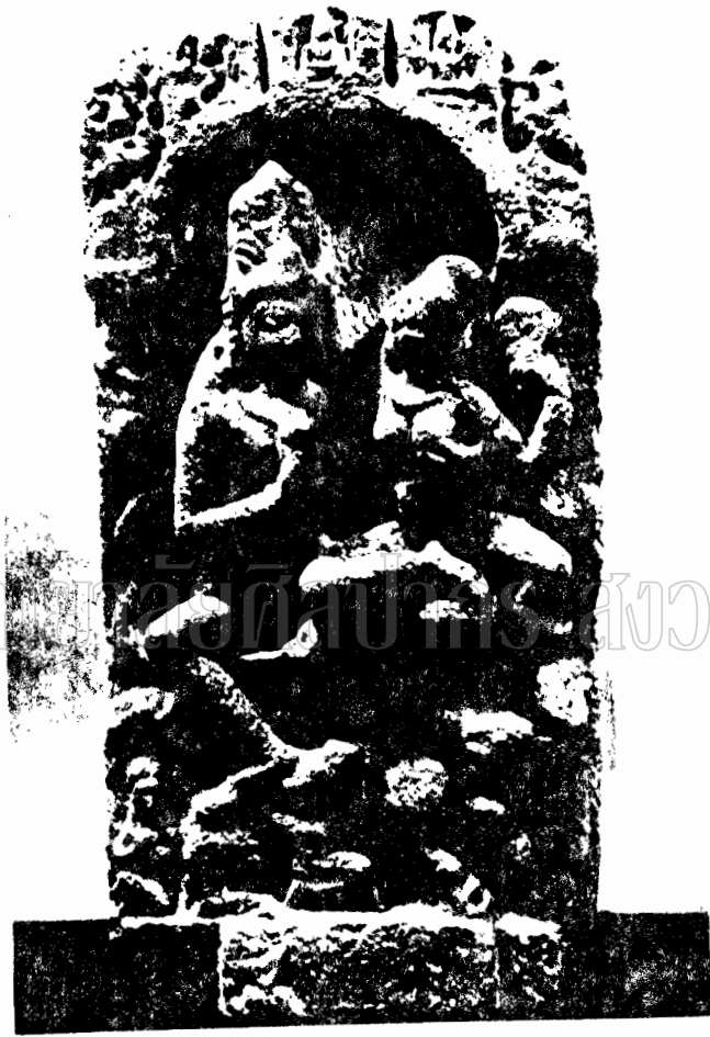
ภาพที่ 24 ภาพสลักปูนปั้นรูปพระอุบาละเถระ สันนิษฐานว่าได้จากอินเดีย (ลักษณะที่ 17)

(Medieval Sculpture from Eastern India F.16)