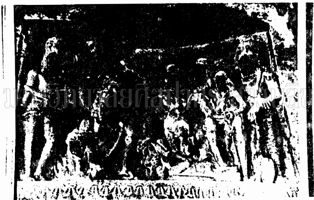
ภาพที่ 29 ภาพสลักปูนขาวพระคณานันทที่ดำเอนดูราเป็นโลปะปะแกอังกุปะตะ (พุทธศตวรรษที่ 11-14)