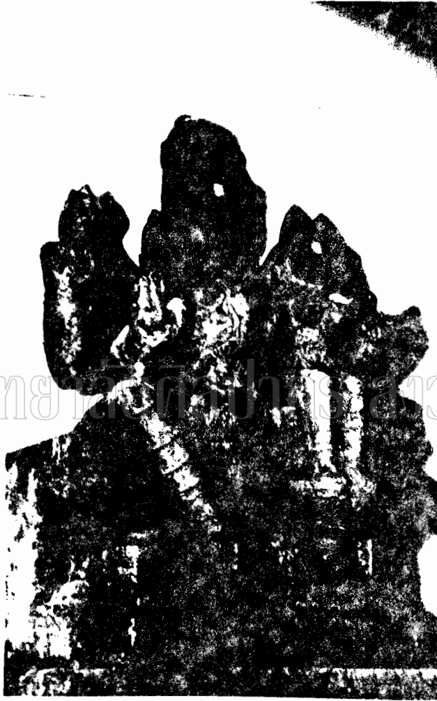
ภาพที่ 38. ประติมากรรมลอยตัวพระอุมาและเนลอร์ที่วัดกาลวิจิตรมาก เมืองเวลส์ สมัยไมกละ (พุทธศักราชที่ 11-14)