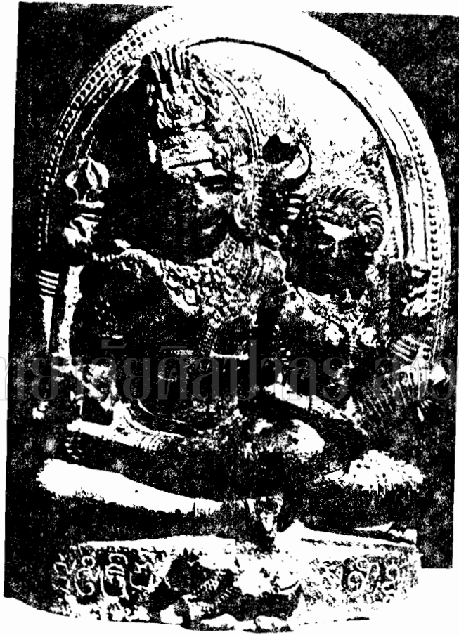
ภาพที่ 40 ภาพลัคนาของพระอานันทะ วรที่ในลัคนา จั เนศวร (พระอานันทะ วรที่ 14) ที่อุ้งนันทะที่ลัคนาในลัคนา (Masterpieces of Indian Sculpture F.47)