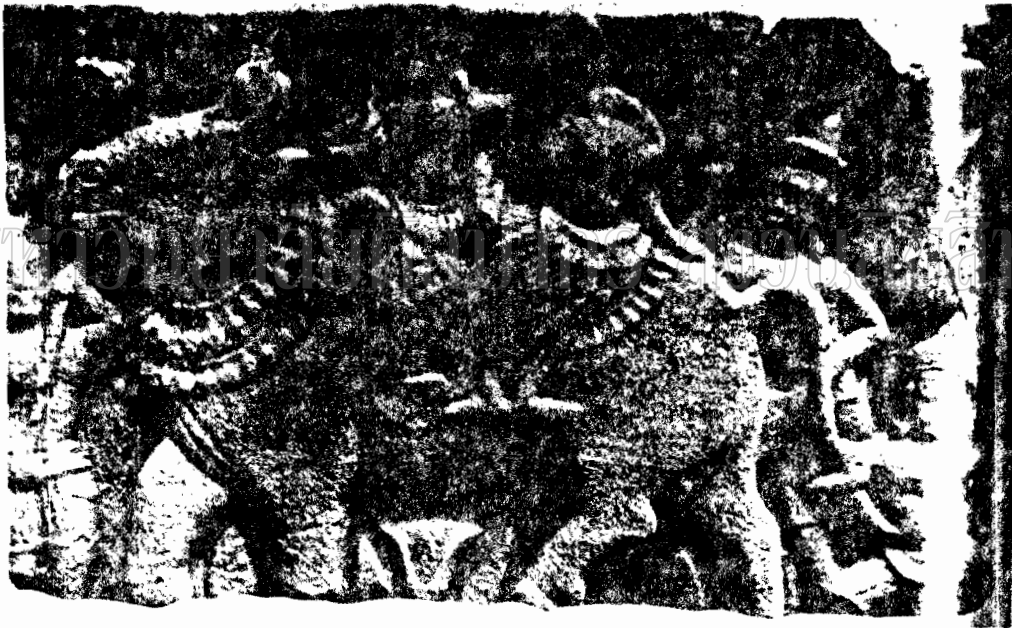
ภาพที่ ๕๕ ภาพสลักปูนปั้นพระอุมาและพระนารายณ์ในอุโมงค์พระราชมณเฑียร จ. น. รราชมณเฑียร (ราชบัณฑิตยสถาน ปี ๑๐) (๑) ราชบัณฑิตยสถาน ราชบัณฑิตยสถานและกรมศิลปากร ๒๕๐๒ รูปที่ ๑๐)