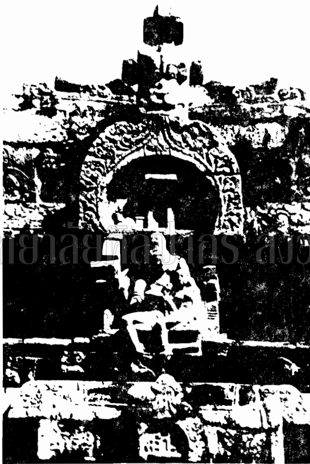
ภาพที่ ๕๔ ภาพสลักหินที่นคร อุณาเมศวร ประทับพระเชษฐภคินี ที่เมืองมอญบุรี เป็นลวดลายศิลปะ (Indian Medieval Sculpture F.208)