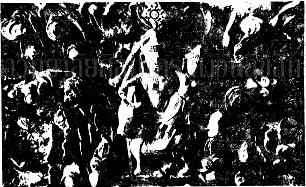
ภาพที่ 62 ภาพสลักปูนปั้นระอุมาเทวาวรรณทัณฑ์หลังปราสาทเมืองสิงห์ จ. นครบุรี (อาจร้าวจากพุทธศตวรรษที่ 17) แสดงให้เห็นรักษาไว้ได้มีลักษณะสถาน สมเด็จพระนางราชย์มหาราช จ. นครบุรี