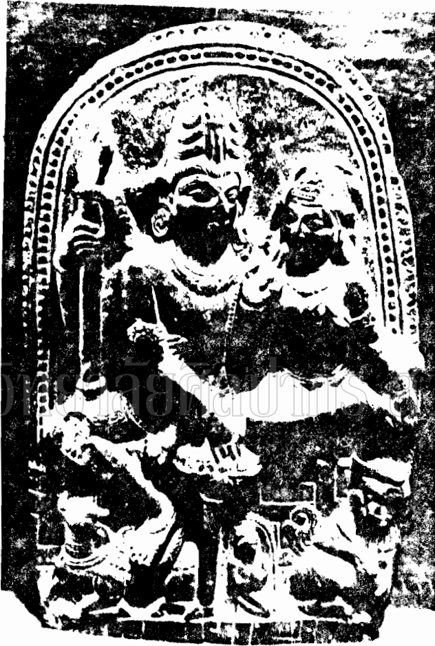
Plate 185. C. 185. A. 185.

ภาพที่ 16 ภาพสลักปูนปั้นพระพุทธรูปแบบพระพุทธรูปแบบอินเดีย (พุทธศตวรรษที่ 13)