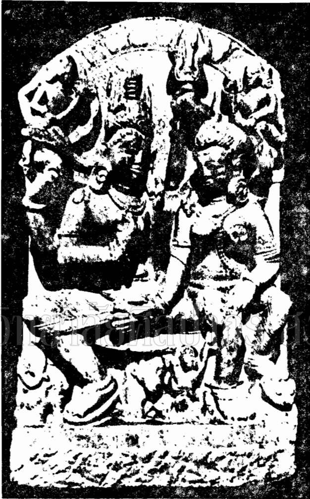
ภาพที่ ๗ - ภาพสลักหินในวัดกุญชรปุระ จังหวัดมณฑลปัญจาบ (จาก ทรูม ฟี ๑๖)

(Brahmanical Icons in Northern India F.19)