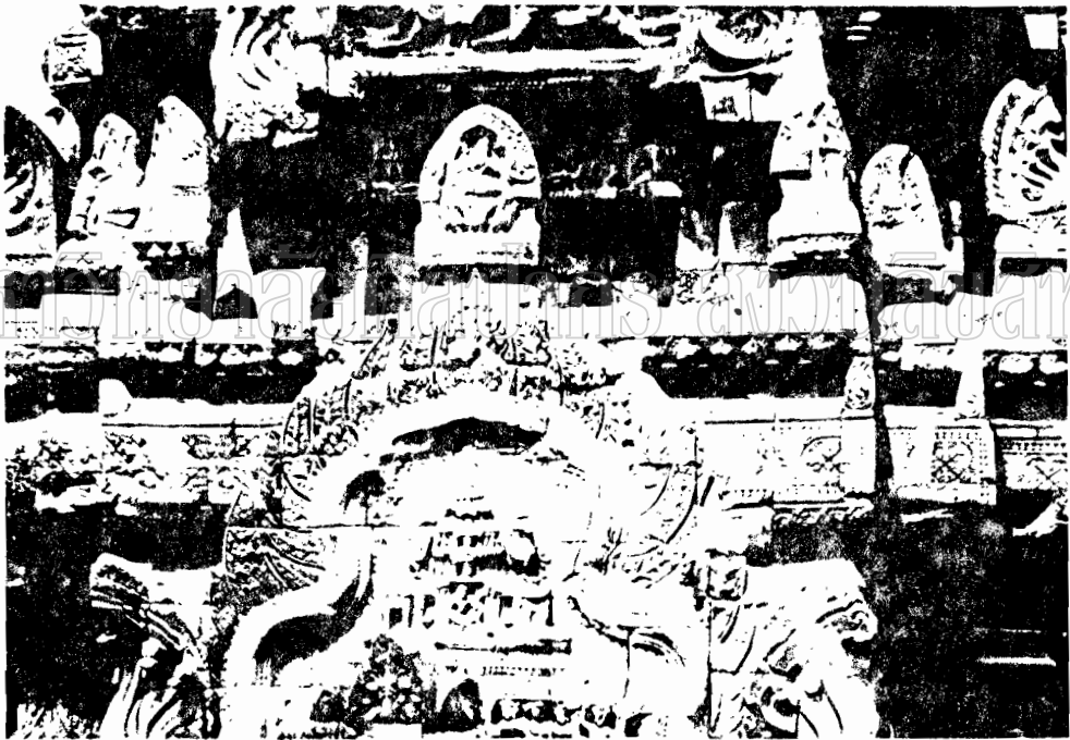
ภาพที่ 60 ภาพสลักปูนปั้นระดมามเหศวรบนแท่นหินอ่อนที่ฐานของพระพุทธรูปปางสมาธิของพระราชมารดา พระบาทสมเด็จพระปกเกล้าเจ้าอยู่หัว จ.บุรีรัมย์ ราว พ.ศ. 1650-1750