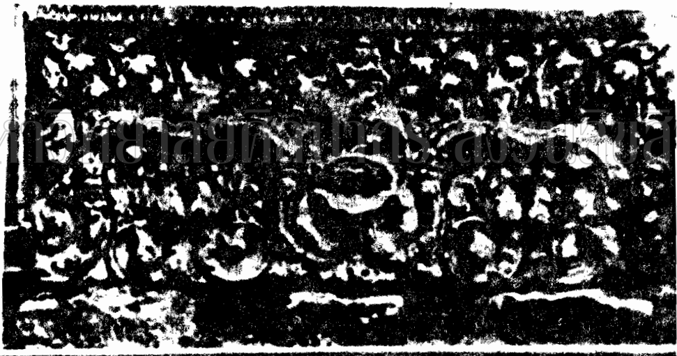
ภาพที่ 52 ภาพสลักปูนปั้นพระอุมาเทศวรบนทับนังวัดพระรัตน เป็นศิลปะทอม แบบล้านช้างหรือลาว (ศิลปะทอมเดิม 1 รูปที่ 33)