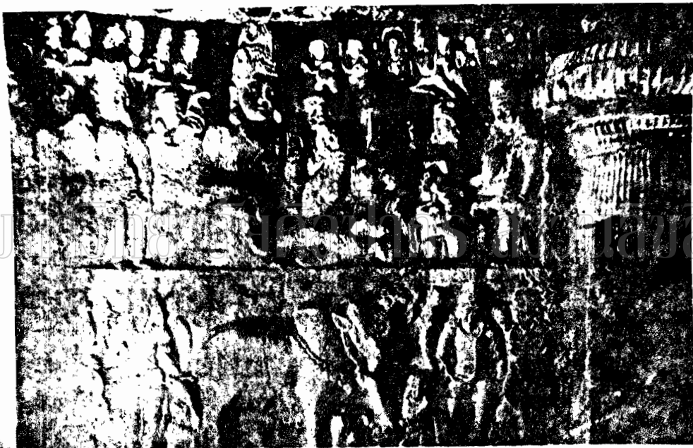
ภาพที่ 28 ภาพสลักปูนปั้นพระอุมาเทว วรที่งำเอศสุรารัศมีจนถึงอุทิศเป็นเทวกัน (Element of Hindu Iconography F.28)