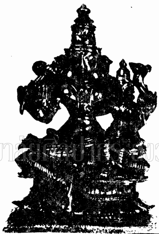
ภาพที่ 47 ประติมากรรมเจ้าวิศณุพระสุกามเทศวร ที่มหาเทวาลัย 13.6 ซม. (พุทธศตวรรษที่ 24)