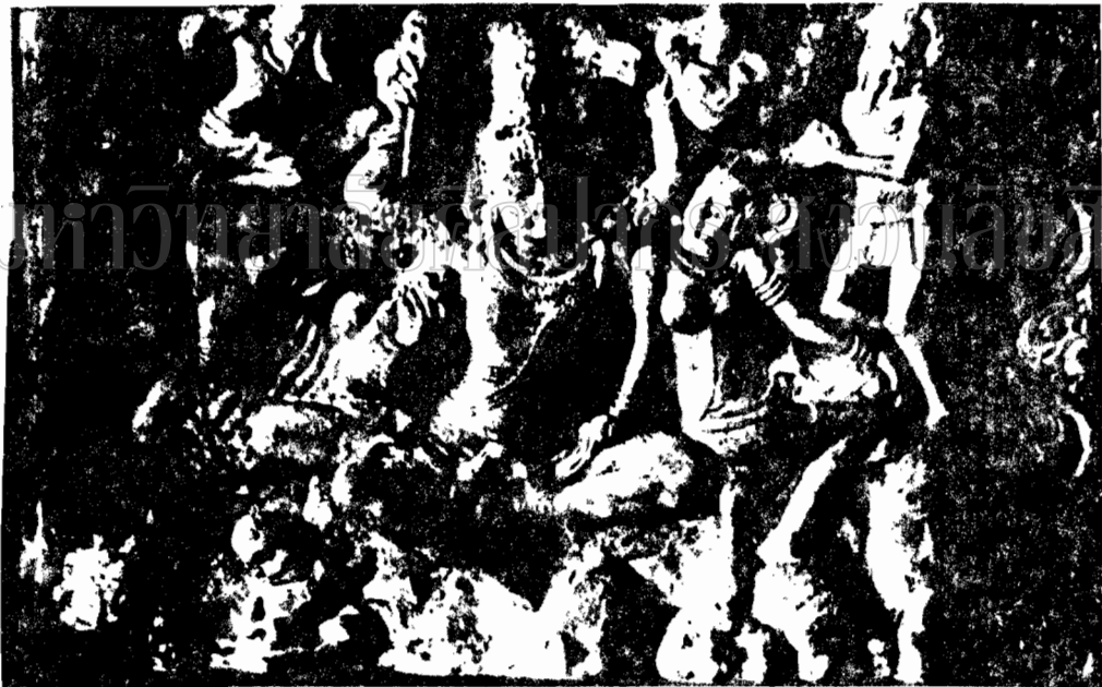
ภาพที่ 33 ภาพสลักปูนปั้นระฆังนารายณ์และพระลักษมณ์ทรงช้างคู่พระที่นั่ง (พุทธศตวรรษที่ 13)