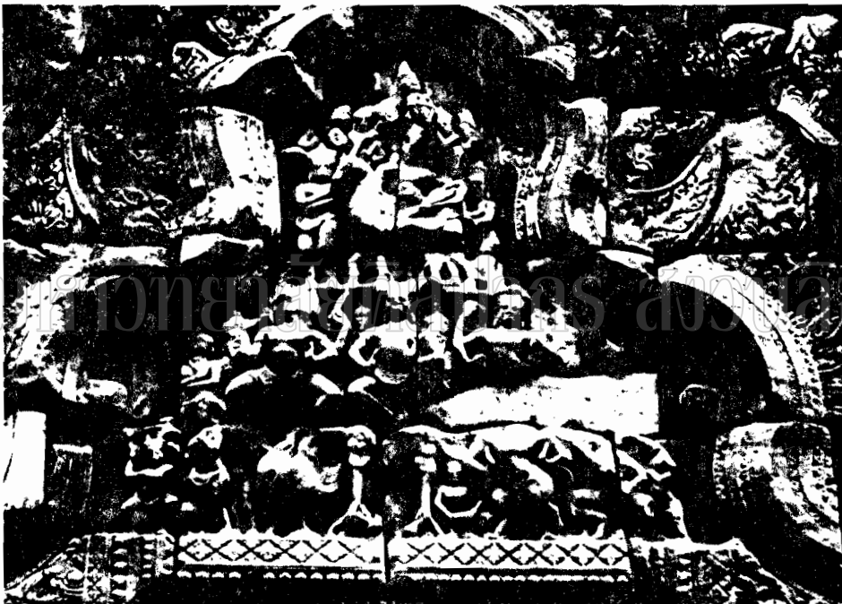
ภาพที่ ๑๖ ภาพสลักนูนต่ำพระอุมาและพระนันทนของปราสาทหินพิมาย จ. นครราชสีมา (อายุราวกลางพุทธศตวรรษที่ ๑๗)