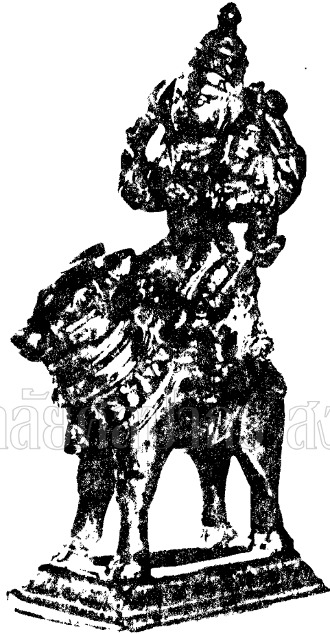
ภาพที่ ๑๑ รูป วิหารธรรมรูประฆฆนามเพนรกลอยด้วย เมฆจากสำรับ เพนระคิมารอง ในลัทธิเจ้ง (พุทธศตวรรษที่ ๑๑)