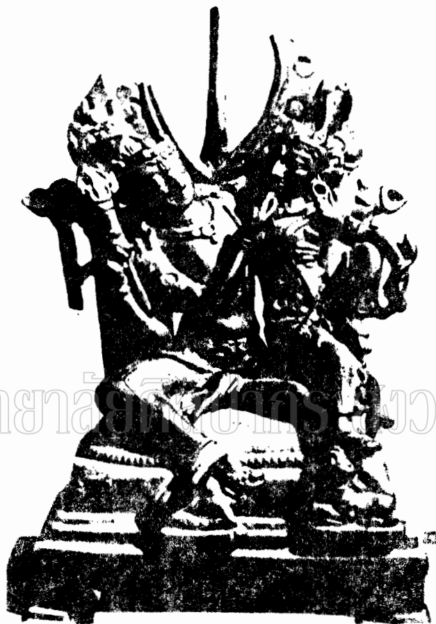
Figure 13. The Bodhisattva, Pala-Sena School of Sculpture.

ภาพที่ 13 ประติมากรรมลอยตัวรูปพระพุทธรูปปางสมาธิที่มีพระหัตถ์หลายพระหัตถ์ จากวัดกุฎีขาว จ. พิษณุ (พุทธศตวรรษที่ 15-16) (Pala-Sena Schools of Sculpture F.47)