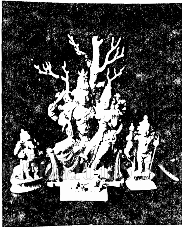
Figure 1. Lord Venkateswara, Tirumala - Peruvanthi School of Arts

ภาพนี้ คือ ประติมากรรมขององค์พระ ขุนขาม ณ บริเวณจากงาขาว เป็นศิลปะ กลุ่มทวารวดีในสมัย