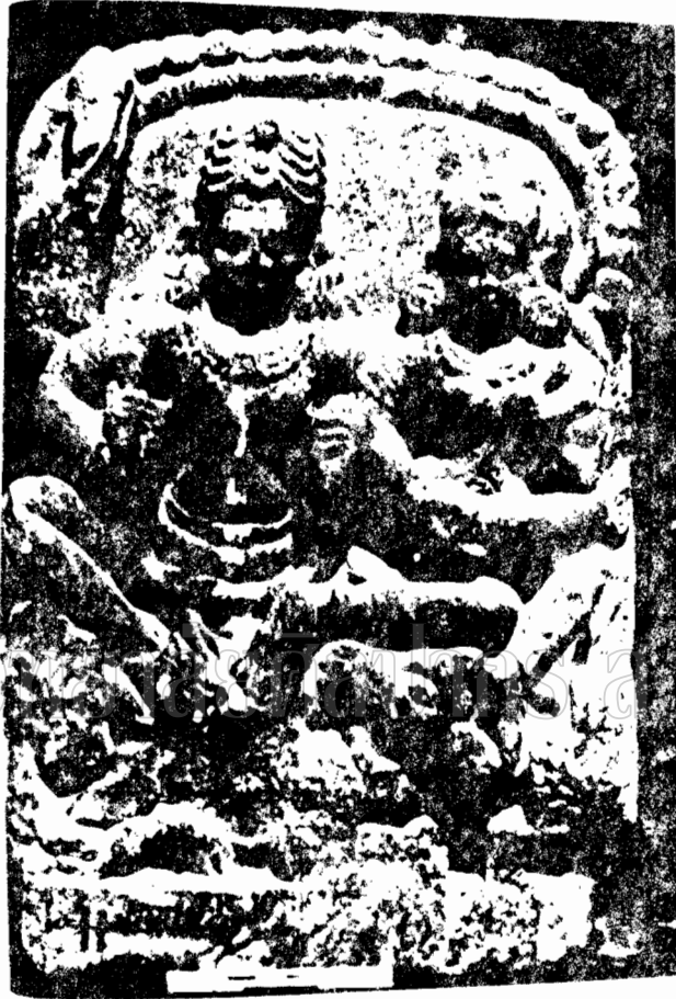
ภาพที่ 5 ภาพสลักปูนปั้นพระอุมาและพระพิฆเนศ (พบที่ เมืองคานนauj 11-12)

(Brahmanical Icons in Northern India P.17)