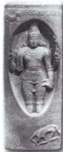
รูปที่ ๑๒ พระศิวะปรากฏพระวรกาย ตรงกลางศิวสิงค์ (สิงโคทภามูรติ) (ศิลา) ศิลปะอินเดียสมัยโจทะ (อายุราวพุทธศตวรรษที่ ๑๗-๑๘) สูง ๑๒๐ ซม. อยู่ในพิพิธภัณฑสถานเมืองนิวยอร์ก สหรัฐอเมริกา