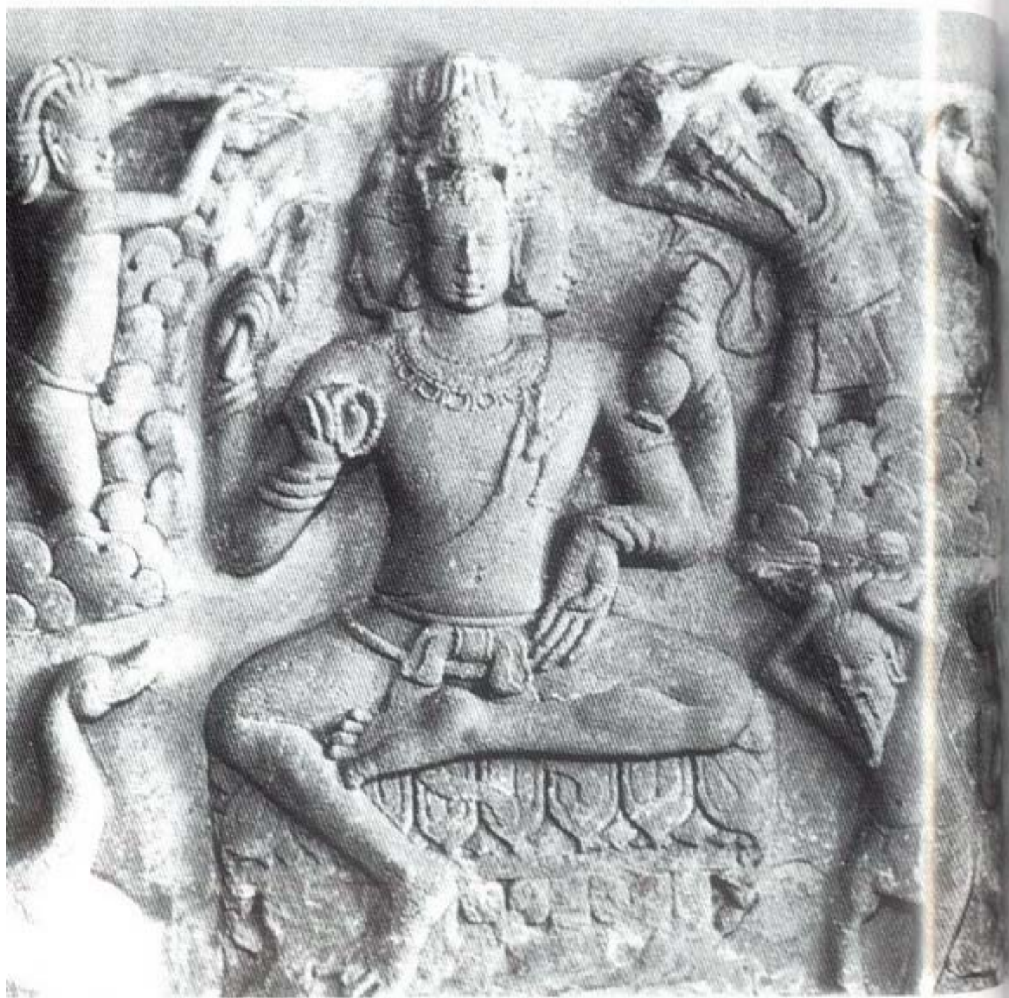
รูปที่ ๑๖ พระพรหมได้รับการสักการะจากพวกฤาษี (ศิลา) ศิลปะอินเดียใต้ (อายุราวพุทธศตวรรษที่ ๑๑-๑๒) อยู่ในพิพิธภัณฑสถานเมืองบอมเบย์ อินเดียภาคตะวันตก