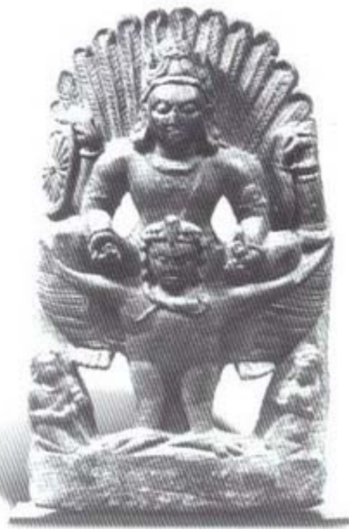
รูปที่ ๑๔ พระวิษณุประทับนั่งบนหลังครุฑ (ศิลา) ศิลปะอินเดียภาคตะวันตก (อายุราวพุทธศตวรรษที่ ๑๓-๑๔) อยู่ในพิพิธภัณฑสถานแห่งชาติ สหรัฐอเมริกา

ในแต่ละอิริยาบถยังแบ่งออกเป็นอิริยาบถละ ๔ รูปแบบย่อยเพื่อให้สอดคล้องของผู้บูชา คือ ๑. รูปแบบโยคะ ๒. รูปแบบโภคะ ๓. รูปแบบวีระ ๔. รูปแบบอาภิจาริกะ