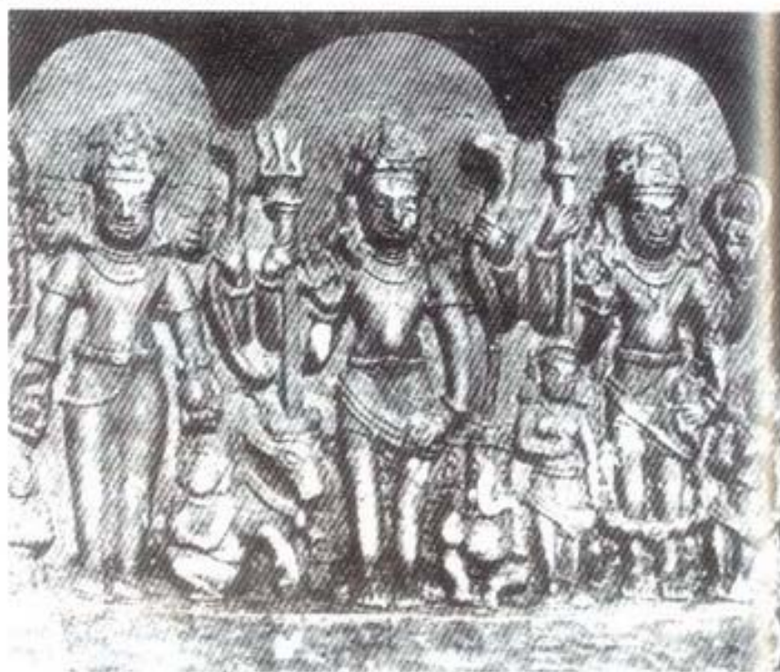
รูปที่ ๑๕ พระกัศยาปเตระยะ (หรือ พระ-ปิตามหะ) อวตารของศิวมูติ (ศิลา) ศิลปะอินเดียภาคเหนือ (อายุราวพุทธศตวรรษที่ ๑๖-๑๗) อยู่ในพิพิธภัณฑ ์สถานแห่งชาติ ในแคว้นอุตตรประเทศ อินเดียภาคเหนือ