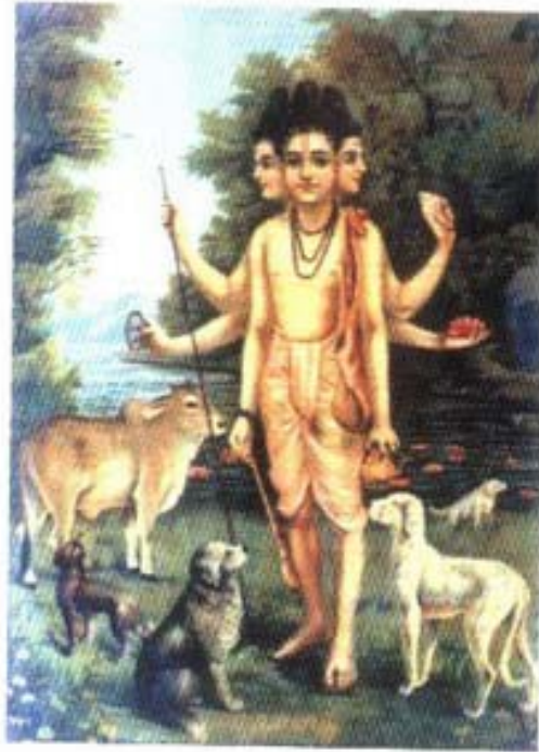
รูปที่ ๒๐ ทัตตาเตรยะ (๓ เคียร)

นักบวชฮินดูและได้รับนามว่า ศรีปาต-ศรีวัลลภะ (Śrīpāda-śrīvallabha) วัดสุดท้ายที่ท่านพำนักอยู่ที่ กุรุวปุระ (Kuruvarapura) ริมฝั่งแม่น้ำ กฤษณา ส่วนอวตารครั้งที่ ๒ นั้นลงมาเป็นลูกของ พราหมณ์มธวะและนางภวานี ที่หมู่บ้านชื่อ กรัญชะ ได้ออกบวชเป็นนัก บวชฮินดู ได้รับนามว่า นฤสิงหสรสวตี (Nṛsimha-Sarasvatī) วัดสุดท้ายที่ท่านพำนัก อยู่ที่ตำบลคนคปุระ (Ganagapura) ริมฝั่งแม่น้ำภิมะ (Bhīma) ชาวฮินดูจะนิยมสร้างรูปทัตตาเตรยะให้มี ๓ เคียร (รูปที่ ๒๐) เพื่อสื่อความหมายถึง เทพผู้ยิ่งใหญ่ทั้งสามองค์ (ตรีมูรติ)