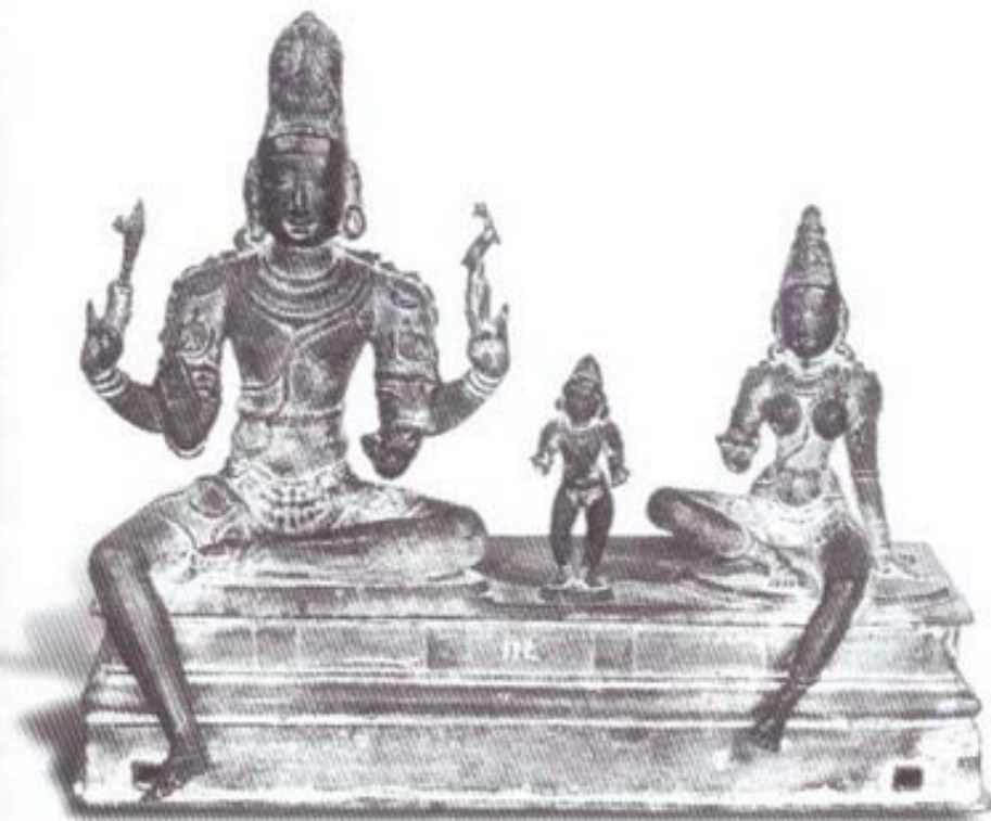
รูปที่ ๔ พระศิวะ พระนางปารวตี และพระสกันทะ (โสมาสกันทะ) (สำริด) ศิลปะอินเดีย สมัยโจฬะ (อายุราวต้นพุทธศตวรรษที่ ๑๖) สูง ๕๑ ซม. อยู่ในหอศิลป์ เมืองคันชัวร์ อินเดียใต้