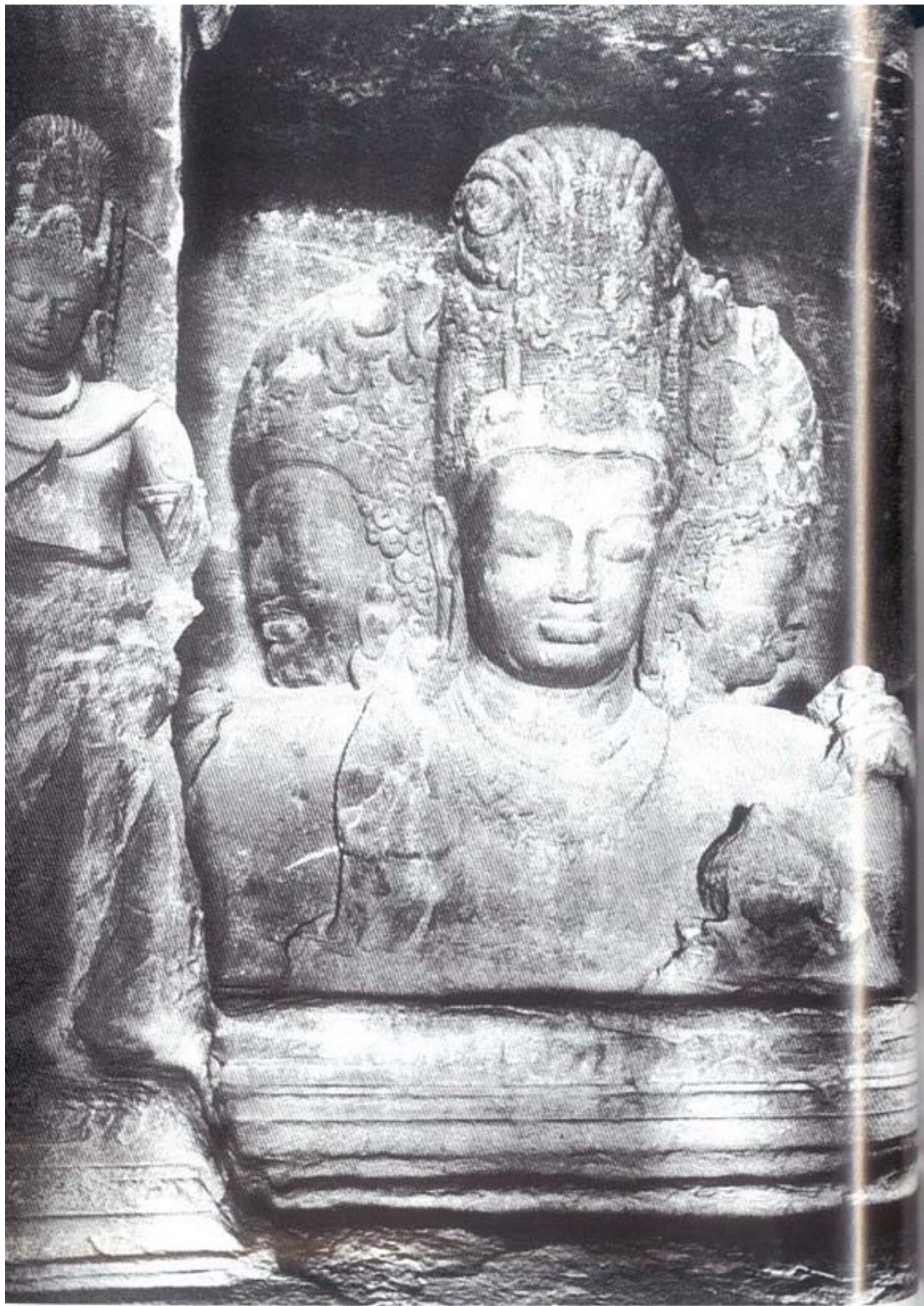
รูปที่ ๗ พระศิวะในรูปมเหศวร (ศิลาลัก) ศิลปะอินเดียสมัยหลังคุปตะ (อายุราวพุทธศตวรรษที่ ๑๕) อยู่ในถ้ำเอเลฟันตะ อินเดียภาคตะวันตก