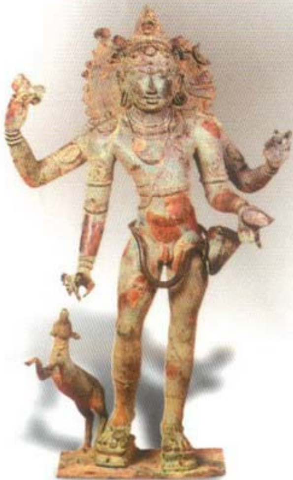
รูปที่ ๓ พระศิวะ ในรูปของไกรว (สำหรับ) ศิลปะอินเดีย สมัยโจระ (อายุราวพุทธ ศตวรรษที่ ๑๘) อยู่ในหอศิลป์ เมืองตันจัวร์อินเดียใต้