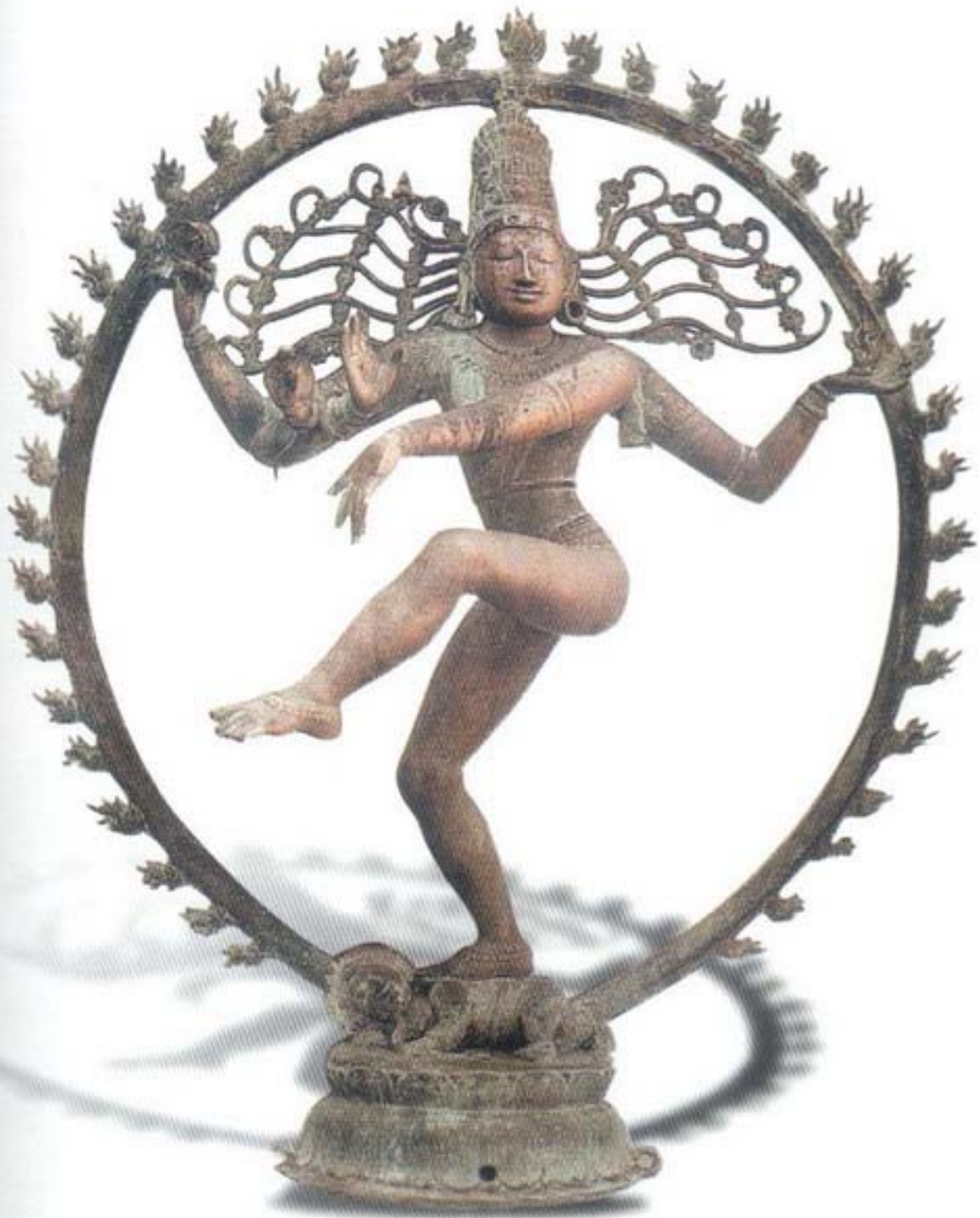
รูปที่ ๔ พระศิวะนาฏราช (สำริด) ศิลปะอินเดียสมัยโจฬะ (อายุราวพุทธศตวรรษที่ ๑๕-๑๖) สูง ๑๑๓ ซม. อยู่ในวัด กันกาลณาด เมืองคันชัวร์อินเดียใต้

๓. ภาคฟ้อนรำ (นฤตตมูรติ) ในภาคนี้ได้รับยกย่องว่า เป็นราชาแห่งการฟ้อนรำ (นาฏราช) ในการตนาฏยศาสตร์กล่าวถึงท่ารำ ๑๐๘ ท่า เพื่อออกกำลังกาย และเพื่อควบคุมการหมุนของโลก ท่ารำทั้ง ๑๐๘ ท่า ปราภฏเป็นภาพสลักในวิหารนาฏราชที่จิทัมพรัมในอินเดียใต้ ท่าที่งดงามที่สุด คือ ท่านาฏราช (รูปที่ ๔)