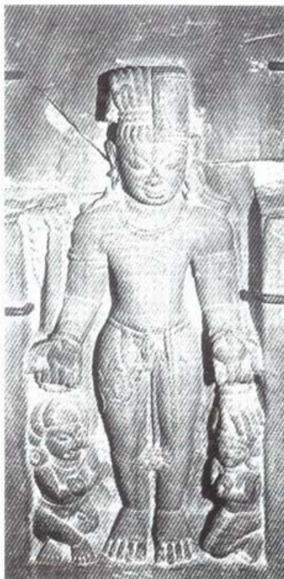
รูปที่ ๑๔ พระวิหระ (รูปผสมของพระศิวะ และพระวิษณุ) (ศิลา) ศิลปะอินเดีย สมัยปาละตอนต้น (อายุราวพุทธศตวรรษที่ ๑๒-๑๓) อยู่ในพิพิธภัณฑ ์เมืองปีฏนา อินเดียภาคเหนือ