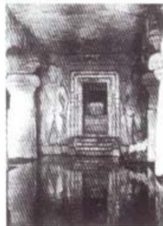
รูปที่ ๕ ครรภคฤหะ ประดิษฐานศิวลึงค์ (ศิลาลัก) ศิลปะอินเดียสมัยหลังคุปตะ (อายุราวพุทธศตวรรษที่ ๑๓-๑๔) ที่ถ้ำเอเลฟันตะ อินเดียภาคตะวันตก

อย่างไรก็ตามแม้ว่าจะมีการสร้างประติมากรรมรูปพระศิวะในรูป แบบต่างๆ หลายรูปแบบ แต่ประติมากรรมประธานในวัดของไศวนิกายนั้น คือ ศิวลึงค์ ซึ่งเป็นสัญลักษณ์ของพลังอำนาจในการสร้างและการให้ กำเนิดสรรพสิ่งทั้งปวงของพระศิวะ (พลังอำนาจฝ่ายชาย) ไศวนิกายจะ นิยมสร้างรูปศิวลึงค์ศิลาประดิษฐานไว้ภายในครรภคฤหะ (ห้องศักดิ์สิทธิ์) โดยจะสลักติดกับแท่นฐานศิลาภายในห้องศักดิ์สิทธิ์จัดเป็นประติมากรรม ติดที่ ที่เคลื่อนย้ายไม่ได้ (อจละ) เพราะห้ามเคลื่อนย้ายเนื่องจากเป็นสิ่ง ศักดิ์สิทธิ์ (รูปที่ ๕)