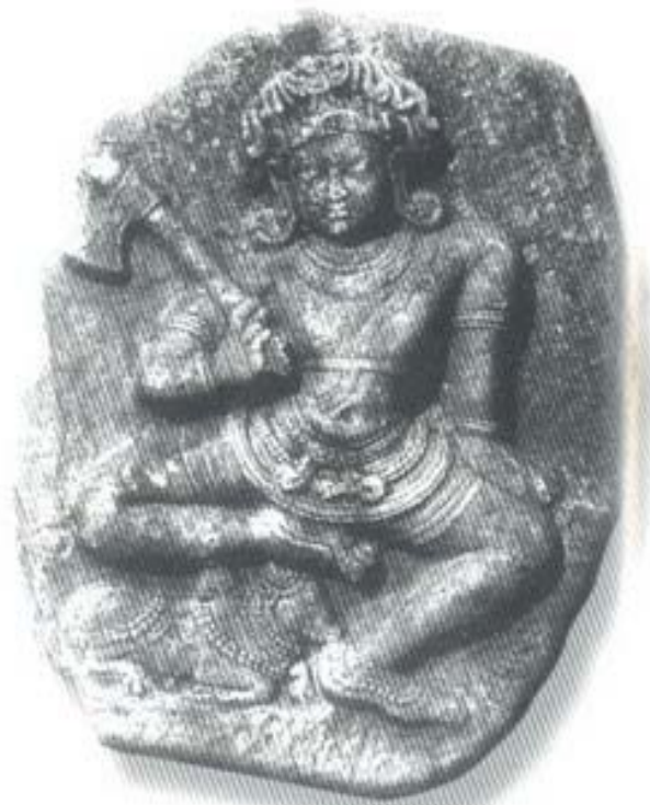
รูปที่ ๑ พระศิวะ และโคณฑิศิลปะ อินเดียแบบปัลลวะตอนต้น (อายุราวพุทธศตวรรษที่ ๑๐-๑๑) อยู่ในพิพิธภัณฑสถานแห่งชาติ เมืองวิชัยวาตะ (Vijayawada) อินเดียใต้