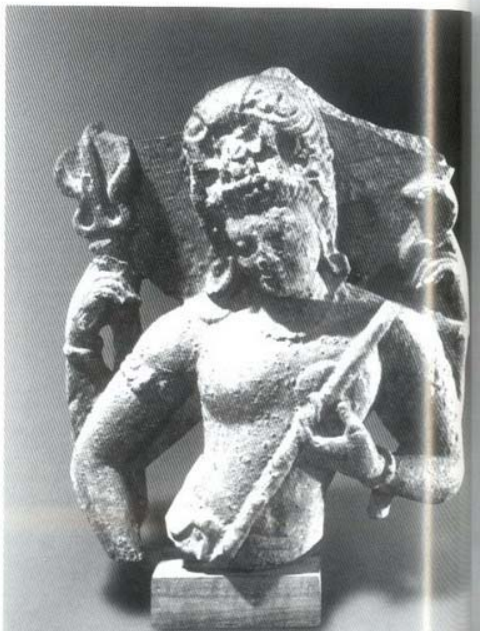
รูปที่ ๖ พระศิวนะในรูป เทพคุสอนตนตรี (วินาฮร ทักษิณามูรติ) (ศิลา) ศิลปะอินเดีย สมัยหลังคุปตะ (อายุราว พุทธศตวรรษที่ ๑๑-๑๒) สูง ๕๔ ซม. อยู่ในพิพิธภัณฑสถาน เมืองซานดีเอโก (San Diego) สหรัฐอเมริกา