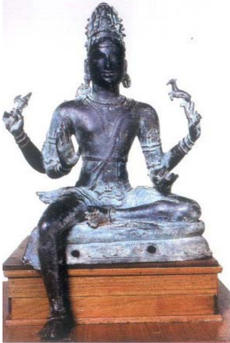
รูปที่ ๒ พระศิวะ ในภาคสงบ (มี ๔ กร) ๒ กร หลังถือขวานและกวาดำ (สำหรับ) ศิลปะอินเดียสมัยปัลลวะตอนปลาย (อายุราวต้นพุทธศตวรรษที่ ๑๕) สูง ๔๐ ซม. อยู่ในหอศิลป์ เมืองตันจัวร์ (Thanjavur) อินเดียใต้