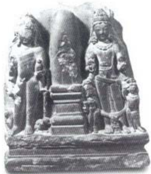
รูปที่ ๑๑ ศิวสิงค์ ขนาบข้างด้วย พระพรหมและพระวิษณุ (ศิลา) ศิลปะอินเดียภาคเหนือ ในเขตกัศมีร์ (แคชเมียร์) (อายุราวพุทธศตวรรษที่ ๑๓-๑๔) สูง ๑๔ ซม. อยู่ในพิพิธภัณฑสถานเมืองบรูคลิน (Brooklyn) สหรัฐอเมริกา