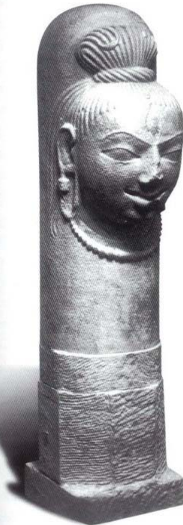
รูปที่ ๑๐ มุขสิงค์ (ศิลา) ศิลปะอินเดียสมัยคุปตะ (อายุราวพุทธศตวรรษที่ ๑๐) สูง ๑๔๗ ซม.