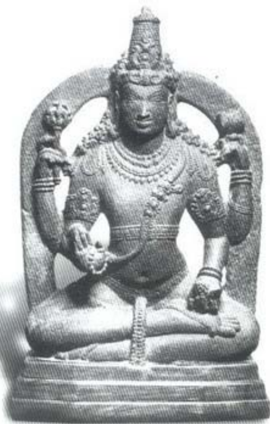
รูปที่ ๕ พระศิวนะในรูปเทพคุสอนฤาษี (โยคะทักษิณามูรติ) (ศิลา) ศิลปะอินเดียสมัยโจทะ (อายุราวพุทธศตวรรษที่ ๑๕-๑๖) สูง ๔๔ ซม. อยู่ในพิพิธภัณฑสถาน สหรัฐอเมริกา