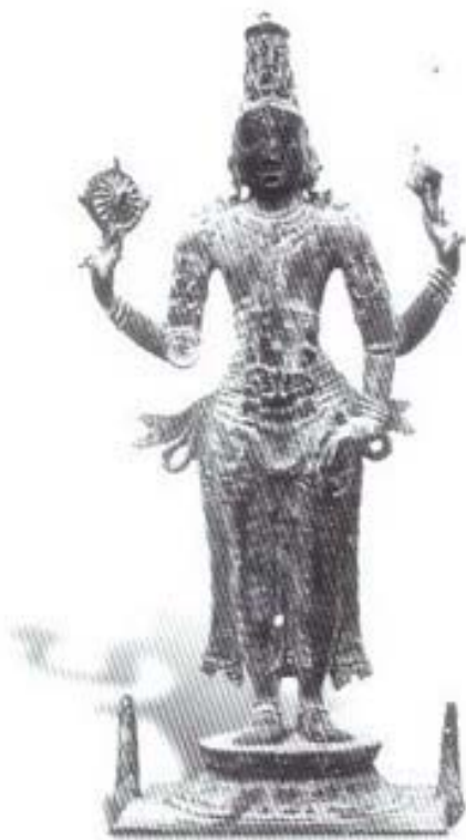
รูปที่ ๑๓ พระวิษณุ ประทับยืน (ศิลา) ศิลปะอินเดียสมัยโจฬะตอนต้น (อายุราวพุทธศตวรรษที่ ๑๕-๑๖) สูง ๒๖ ซม. อยู่ในพิพิธภัณฑสถานแห่งชาติ นิวเดลี