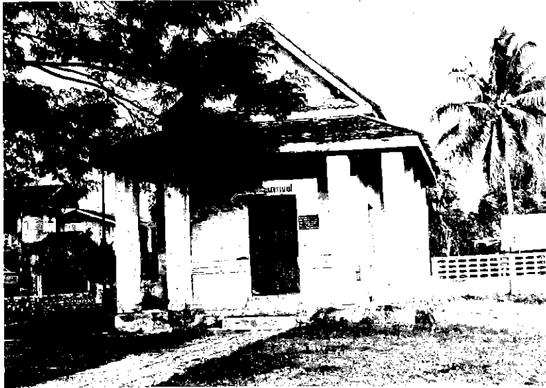
หอพระนารายณ์ อำเภอเมือง จังหวัดนครศรีธรรมราช โบราณสถานเนื่องในศาสนาพราหมณ์

๔.๔ ใช้ินทานมาปรุงแต่ง เป็นหนังสือสำหรับนักเรียนระดับ ต่างๆ โดยอาศัยเทคนิควิธีให้ สอดคล้องกับยุคสมัยทั้งระบบการ พิมพ์และการจัดภาพประกอบ