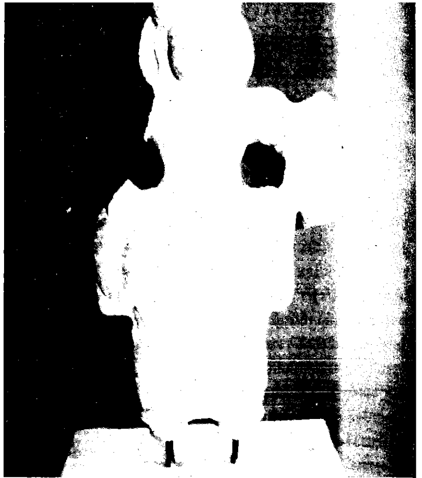
พระนารายณ์ โบราณวัตถุเนื่องในศาสนาพราหมณ์ พบในอำเภอยะลา สิบล เมือง นครศรีธรรมราช