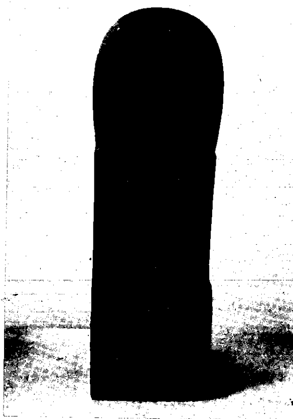
สลิงค์ โบราณวัตถุ เืองในศาสนาพราหมณ์เป็นองค์แทนพระอิศวร พบในเขตอำเภอลิขิต ท้าศาลา เมือง นครศรีธรรมราช

เมื่อพระผู้เป็นเจ้าทั้งสองทรงตกลงกันแล้วพระอิศวรจึงได้ทรงขึ้นไปยืนด้วยพระบาทเพียงข้างเดียวบนหลังพญานาคราช ในลักษณะท่าไขว่ห้างดังกล่าวแล้ว พญานาคราชก็ไกวตัวขึ้นๆ ... และแรงขึ้นๆ ตามลำดับ แต่พระผู้เป็นเจ้าก็ไม่ได้หวั่นไหวยังทรงยืนประทับอยู่ในท่าเดิมเช่นนั้นไปโดยตลอด