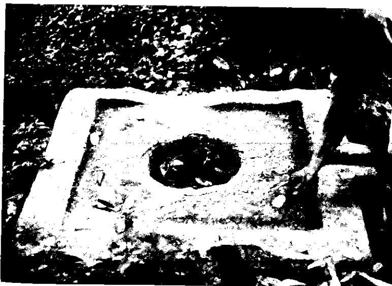
โยนิ โบราณวัตถุเนื่องในศาสนาพราหมณ์เป็นองค์แทนพระอุมา พบในบริเวณเดียวกับพบศิวิลิ้งค์

๔.๓ ใช้นิทานพื้นบ้านสื่อในการเรียนการสอนในสถานศึกษา และเป็นเครื่องมือสื่อสารในการพูดการเขียนในโอกาสอันควร