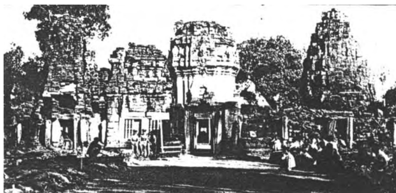
ภาพที่ 1 ภาพถ่ายปราสาทหินพิมายก่อนการบูรณะ

การศึกษาประวัติศาสตร์อารยธรรมเขมรในประเทศไทยส่วนมากเป็นการศึกษาเพื่อจำแนกและกำหนดอายุเวลาโบราณวัตถุสถานที่ได้รับอิทธิพลทางวัฒนธรรมจากเขมร ซึ่งก็คือการศึกษาในเรื่องรูปแบบศิลปะ (style) และที่ปราสาทหินพิมาย อำเภอพิมาย จังหวัดนครราชสีมา (ภาพที่ 1-2, แผนผังที่ 1) ซึ่งเป็นปราสาทหินในอารยธรรมเขมรที่มีขนาดใหญ่ที่สุดในประเทศไทย ก็มีนักวิชาการหลายท่านทำการศึกษาไว้ ส่วนมากเป็นการศึกษาเกี่ยวกับเรื่องรูปแบบลักษณะทางสถาปัตยกรรมและองค์ประกอบทางสถาปัตยกรรม กล่าวคือ