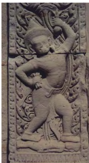
ภาพที่ 3 ภาพพระวัชรสัตว์พุทธเจ้า หน้าเสาประดับกรอบประตูปราสาทประธาน

ในส่วนของการศึกษาเกี่ยวกับปราสาทหินพิมาย ถือได้ว่าพริยะเป็นนักวิชาการไทยคนแรกที่น่าเสนออย่างเป็นระบบว่า ปราสาทหินพิมายเป็นศาสนสถานที่สูงขึ้นในพุทธศาสนา ลัทธิวัชรยาน “โดยเห็นได้จากรูปพระวัชรสัตว์ซึ่งถือวัชรในพระหัตถ์ขวาและกระดิ่งในพระหัตถ์ซ้าย สลักไว้ที่เสาประตูของปราสาท” 29 (ภาพที่ 3) และยังได้เสนอว่าการที่ปราสาทหินพิมายหันหน้าไปสู่วิศัยได้อันเป็นทิศแห่งความตายนั้น เพราะพระเจ้าชัยวรมันที่ 6 ทรงสร้างปราสาทหินพิมายเพื่อทรงอุทิศถวายบรรพบุรุษของพระองค์ เมื่อทรงสถาปนาราชวงศ์มหิธรปุระขึ้น 30