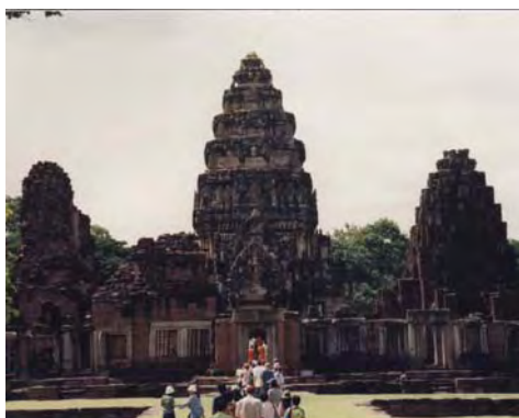
ภาพที่ 2 ภาพถ่ายปราสาทหินพิมายหลังการบูรณะ